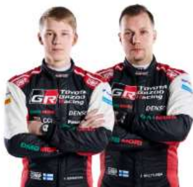
Kalle Rovanperä/Jonne Halttunen

« La Croatie est un tout nouvel événement, nous ne savons donc pas exactement à quoi nous attendre. Nous avons pu étudier les vidéos des spéciales pour en apprendre le plus possible, mais rien ne peut remplacer les reconnaissances et de voir le parcours en vrai. Celui-ci semble assez varié, avec des parties larges et rapides et d'autres bosselées très étroites. Nous devons être capables de nous adapter parfaitement aux différentes surfaces et aux différents types de spéciales auxquelles nous serons confrontés. Nous n'avons pas beaucoup d'expérience avec cette voiture sur asphalte sec ou avec les pneus Pirelli, alors lors des tests nous avons essayé plusieurs réglages différents. Mais la sensation dans la voiture était généralement positive dès les premiers runs. »