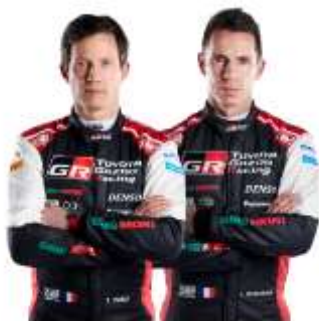
Sébastien Ogier/Julien Ingrassia

« C'est très intéressant d'aller en Croatie pour la première fois avec le WRC, pour ce qui semble être un rallye sur asphalté assez rapide. La chaussée semble généralement assez abrasive, mais il semble qu'à certains endroits elle peut aussi être très glissante. Donc cela pourrait être très difficile pour les pilotes. Normalement, la Yaris WRC est très forte sur l'asphalté, comme nous l'avons vu récemment à Monza et au Monte Carlo, mais nous savons aussi que nous ne pouvons rien tenir pour acquis et que nous devons travailler dur pour réussir. Nous avons fait six jours d'essais en Croatie, en essayant d'utiliser des routes aussi proches que possible de ce que nous nous attendons à trouver sur le rallye. Nous connaissons bien la voiture maintenant et il n'est pas si facile de continuer à faire progresser significativement la configuration actuelle. Donc notre objectif principal a été de savoir comment tirer le meilleur parti des nouveaux pneus Pirelli. »