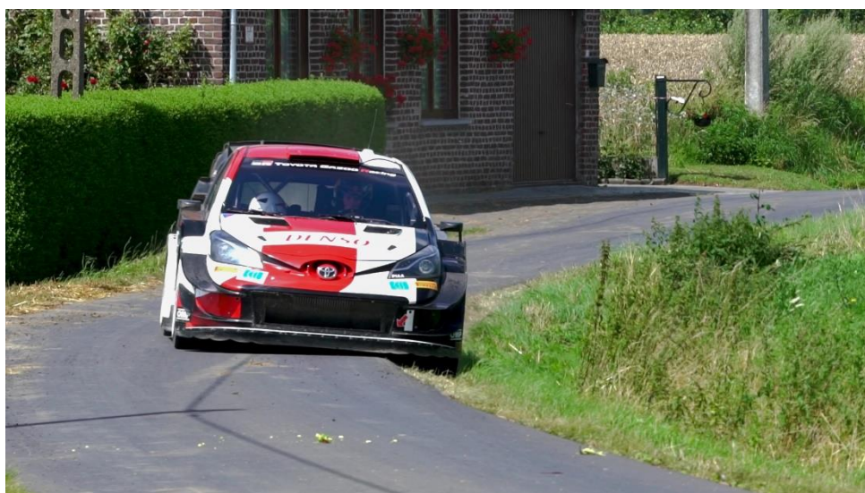
Toyota Yaris WRC 2021

C'est la première fois que le Championnat du Monde des Rallyes FIA fera étape en Belgique. Le Rallye d'Ypres-Belgique 2021 marquera également le retour de la compétition sur asphalté pour la première fois depuis le Rallye de Croatie en mars.