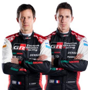
Sébastien Ogier/Julien Ingrassia

été très compétitive et nos pilotes ont été très à l'aise sur l'asphalte. Ces performances peuvent nous donner confiance et notre position en tête du championnat nous fera prendre les départs en premiers, sur des routes qui devraient donc ne pas avoir encore été trop salies. »