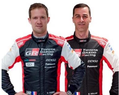
Sébastien Ogier/Benjamin Veillas

« J'ai hâte de retourner au Kenya. L'année dernière, nous avons eu un très bon accueil et une très bonne ambiance. C'était quelque chose de spécial et différent de ce à quoi nous sommes habitués. Gagner était la cerise sur le gâteau et ce sera formidable d'essayer de répéter cela cette année en sachant un peu à quoi s'attendre pour les spéciales. Nous avons vu que cela peut être un rallye très difficile. Je pense que presque tout le monde a eu un problème à un moment donné et, l'an passé, nous avons récupéré plus de deux minutes pour finalement gagner. C'est donc vraiment un rallye où il ne faut jamais abandonner, et cette année, avec des voitures encore si nouvelles, nous devons peut-être être encore plus malins que d'habitude. »