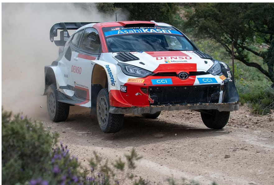
GR YARIS Rally1 HYBRID 2023

Le Safari Rally, qui fête son 70 e anniversaire cette année, est réputé pour être l'un des rallyes les plus difficiles du monde. Il a fait son retour au calendrier du WRC en 2021. TOYOTA GAZOO Racing a remporté les deux éditions organisées depuis lors, décrochant notamment de façon spectaculaire les 4 premières places l'an passé. Une performance qui permet aussi à Toyota de battre tous les records en remportant sa 10 e victoire sur ce rallye !